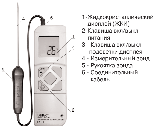
Рис. 1 Основные части прибора ТК -5.01 органы управления