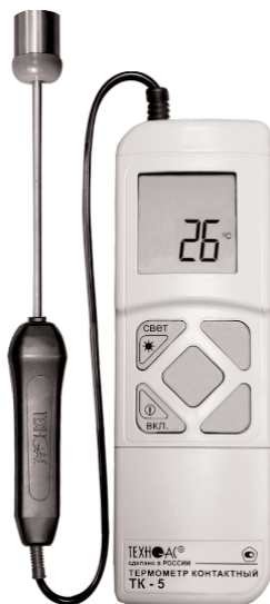
Рис.3 ТК -5.01П

Примечание - Место нанесения заводского номера находится под крышкой батарейного отсека, с тыльной стороны корпуса прибора.