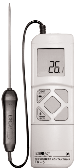
Рис. 2 ТК -5.01М