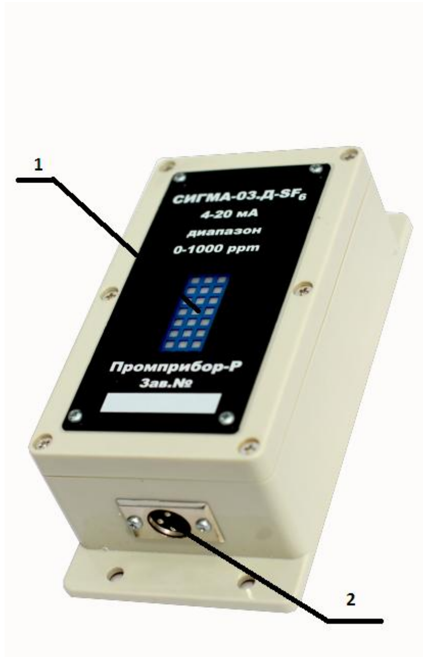
Рис.1. Внешний вид датчика СИГМА-03.Д-SF6.